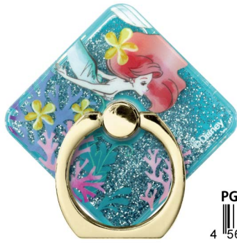
(アリエル) PG-DLQRH07ARL 4 562358 118401