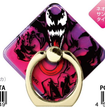
(ヴェノム) PG-DLQRH12VEN 4 562358 118456