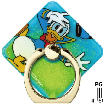
(ドナルドダック) PG-DLQRH04DND 4 562358 118371