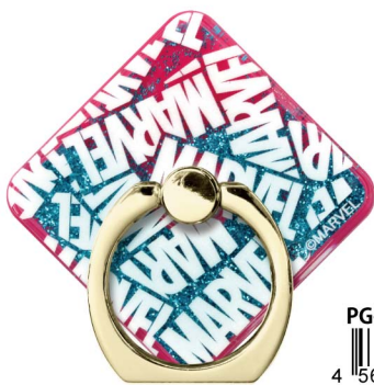
(ロゴ) PG-DLQRH10MVL 4 562358 118432