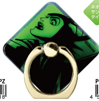
(マレフィセント) PG-DLQRH09VIL 4 562358 118425