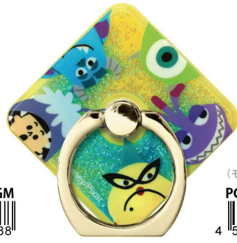
(モンスターズ・インク) PG-DLQRH06MOI 4 562358 118395