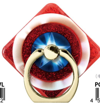
(キャプテン・アメリカ) PG-DLQRH11CTA 4 562358 118449