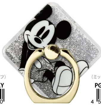
(ミッキーマウス / シルバー) PG-DLQRH02MKY 4 562358 118357