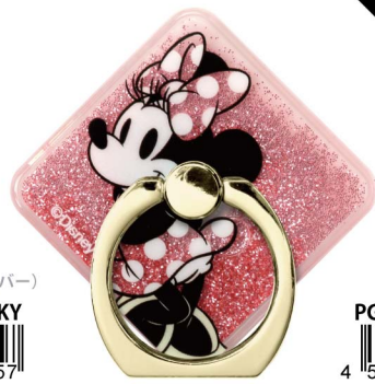
(ミニーマウス) PG-DLQRH03MNE 4 562358 118364