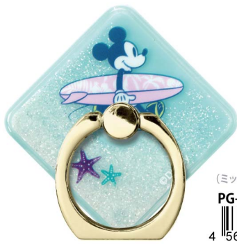
(ミッキーマウス / サーフ) PG-DLQRH01MKY 4 562358 118340